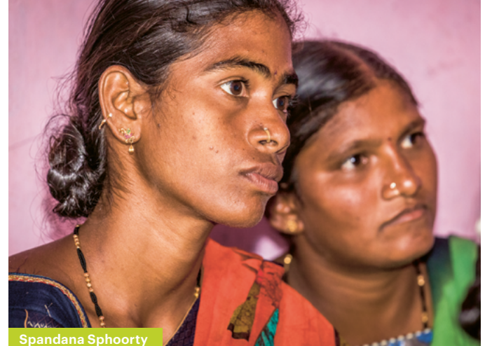
Spandana Sphoorty Indien

Lassen Sie sich von den Erfolgsgeschichten inspirieren, die verdeutlichen, wie gemeinsames Engagement die Lebensumstände von einkommensschwachen Menschen in Indien verbessern kann. Entdecken Sie den ganzen Bericht zur Studienreise und tauchen Sie ein, in die faszinierende Welt Indiens.