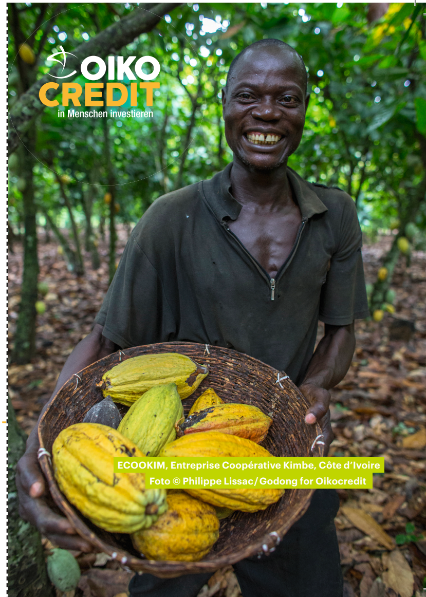
ECOOKIM, Entreprise Coopérative Kimbe, Côte d'Ivoire

Wertpapierprospekt samt allfälligen Nachträgen abrufbar unter www.oikocredit.at